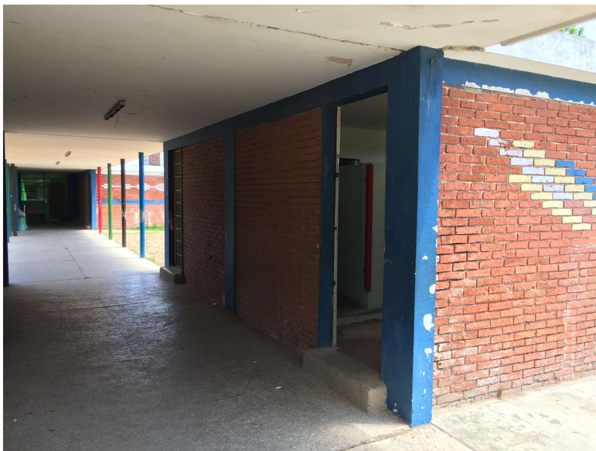
Baños sector A/B a intervenir.